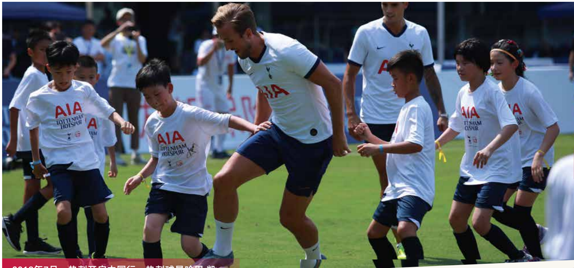
2019年7月，热刺开启中国行，热刺球星哈里·凯恩、德里·阿里、埃里克·拉梅拉对阵友邦100位足球小将，与百年友邦一起活力全开

同时，通过与 英超托特纳姆热刺足球俱乐部 的长期合作，推广足球运动及健康生活理念。