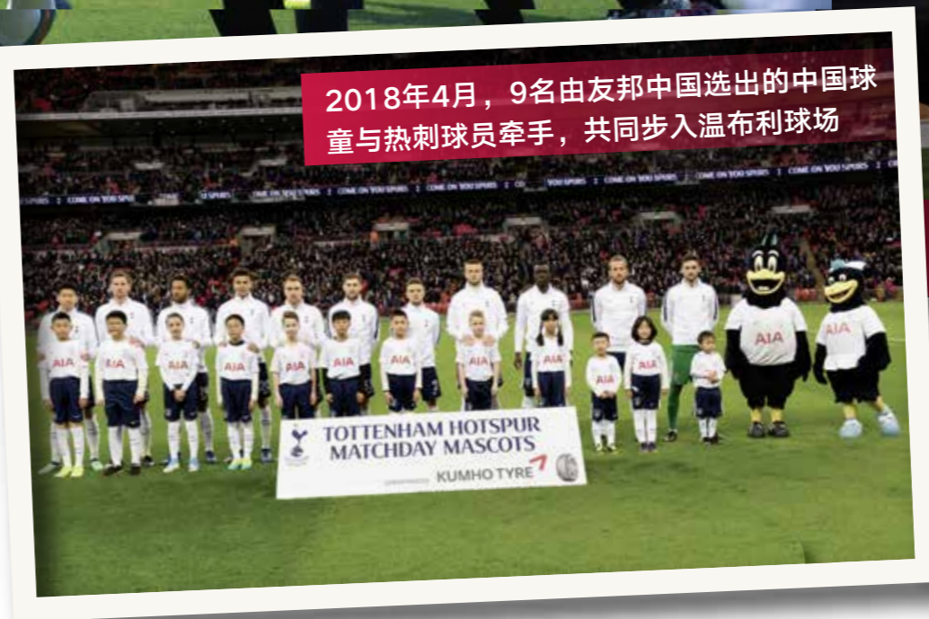
2018年4月，9名由友邦中国选出的中国球童与热刺球员牵手，共同步入温布利球场