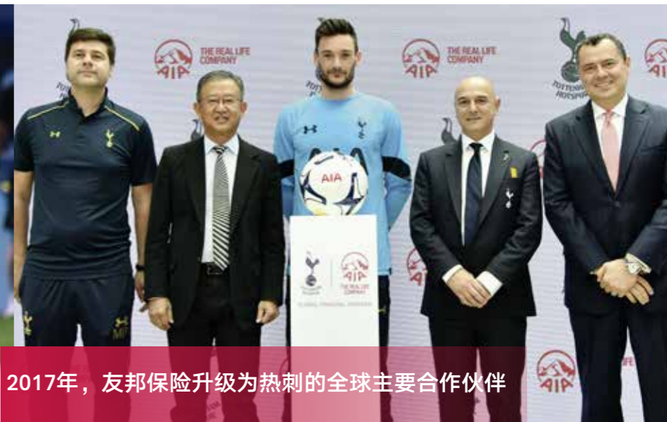
2017年，友邦保险升级为热刺的全球主要合作伙伴