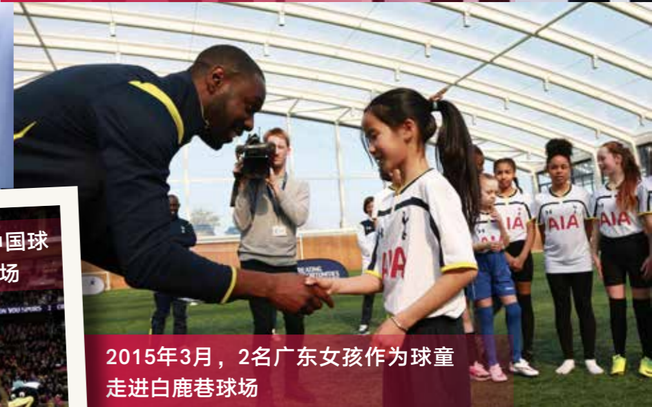
2015年3月，2名广东女孩作为球童走进白鹿巷球场